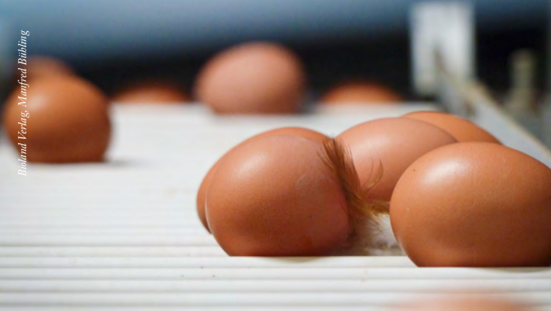
Bioland Verlag, Manfred Böhling